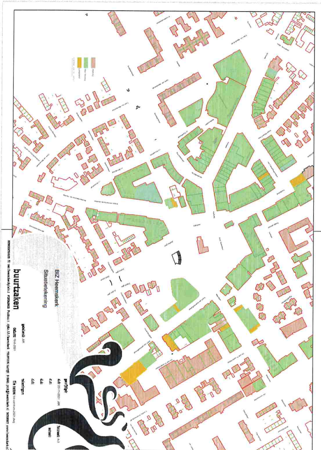
Bijlage 1: Kaart Gebiedsafbakening