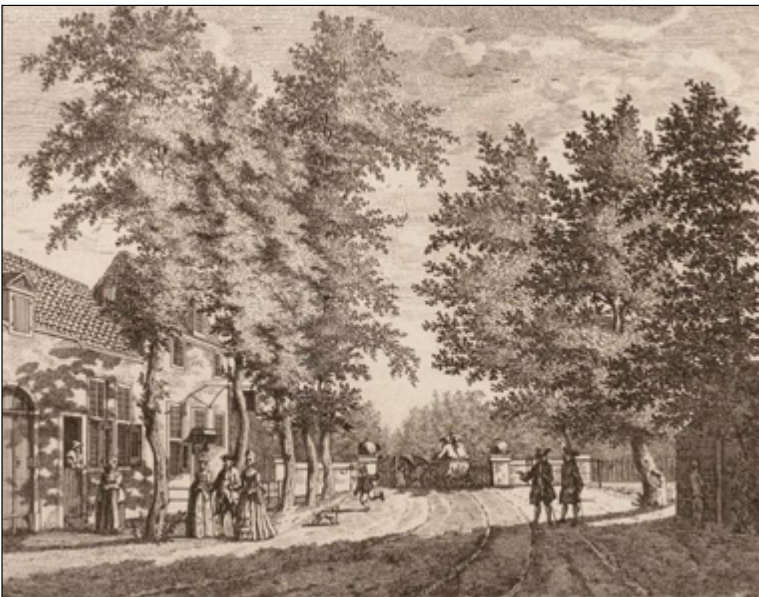
Herberg Oud Romen in Beverwijk

In de middeleeuwen kwam in Nederland de herberg in opmars. Het was een plek waar reizigers konden eten, drinken, overnachten en paarden konden stallen ('uitspanning'). Herbergen waren vanouds gevestigd aan doorgaande wegen en dus ook aan de Heereweg. Zo waren er aan de Hoofdstraat in Santpoort in de 18de eeuw drie bekende herbergen: De Weijman, De Groene Valk en De Wildeman. In Velsen-Zuid waren er langs de route twee; De Prins en Het Roode Hert. In Beverwijk stond op de locatie van het huidige huize Westerhout de herberg Romen (of Oud Romen). En in Heemskerk bevond zich aan de huidige Deutzstraat herberg De Star.