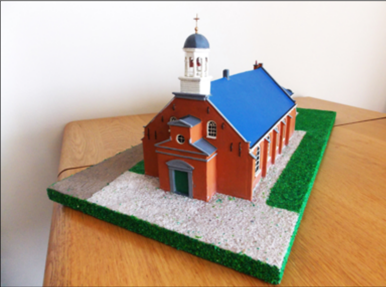
Maquette van oude kerk in Driehuis

De rooms-katholieke kerk in Driehuis is ontstaan in het begin van de 17de eeuw. Voor zover is na te gaan werden er toen kerkdiensten gehouden in een boerderij die gebruikt werd als schuurkerk. Hierbij stond ook het pastoorshuis. In 1723 werd de schuurkerk vervangen door een kerkgebouw dat tegen het pastoorshuis werd gebouwd. In 1839 werd dit kerkgebouw met de pastorie verbouwd. Hiervan zijn de verbouwingstekeningen bewaard gebleven. Op basis van deze tekeningen en oude foto's heeft Jan Morren in 2023 een maquette gemaakt. In 1893/1894 werd de huidige Sint Engelmunduskerk in Driehuis gebouwd. Hierna werd het oude kerkgebouw ingekort en bij de pastorie getrokken. In 1919 kwam een nieuwe