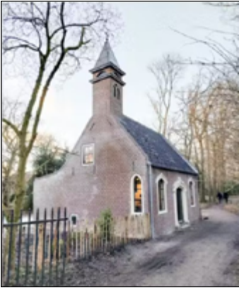
Kapelwoning na restauratie

De kapelwoning die in het landschapspark van Beeckestijn is te vinden, is rond 1770 gebouwd. Het is uniek, want het is een van de vroegste voorbeelden van de neogotische bouwstijl in Nederland. Het gebouwtje bood woonruimte aan personeel van de buitenplaats, maar was tegelijkertijd een soort decorstuk (folly) in het park. Het pand is nu in bezit van vereniging Hendrick de Keyser, die zich inzet voor het behoud van monumentale gebouwen in ons land. Om dit bijzondere erfgoed te behouden, en bovenal klaar te maken voor een duurzaam toekomstig gebruik, is de kapelwoning afgelopen jaar grondig gerestaureerd. Het uitgangspunt van deze restauratie was naast behoud van de cultuurhistorische waarde, ook het versterken en inzichtelijk maken van het gebruik ervan als dienstwoning. Letterlijk hoogtepunt van de restauratie was het terugbrengen van de torenspits die aan de hand van eeuwenoude afbeeldingen is gereconstrueerd. Nu de restauratie is afgerond, kan iedereen deze folly zelf beleven door hier te logeren; de Kapelwoning is namelijk één van de vakantiehuisen van Hendrick de Keyser. Zie hier voor meer informatie en verhuur.