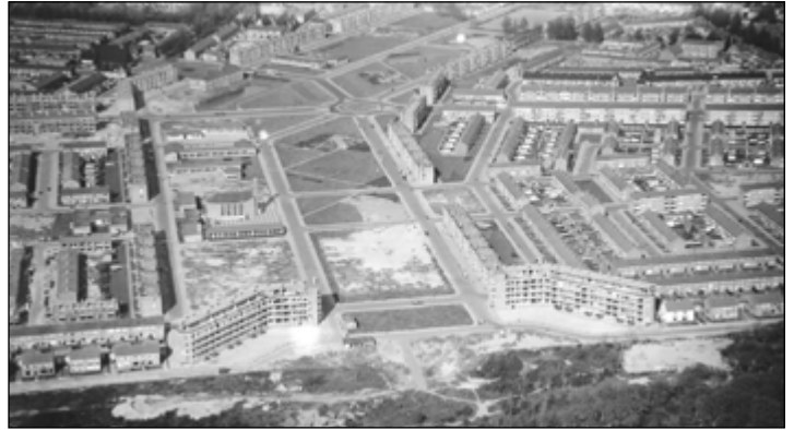
Wederopbouw Duinwijk in IJmuiden

Het plan behelsde ook een prachtige recreatieve route (Heerenduinweg), een echte stedelijke doorgaansweg (Lange Nieuwstraat) en een van de woonwijken afgeschermded industrieweg (Kanaaldijk). En dit zijn nog maar een paar van die kwaliteiten. Dudok-expert Pieter Rings dook in de archieven, fietste rond en vond veel om de wederopbouw de aandacht te geven die ze verdient. De lezing is op 13 mei, klik hier voor meer informatie over locatie en toegangsprijs en aanmelden. Aanmelden is verplicht.