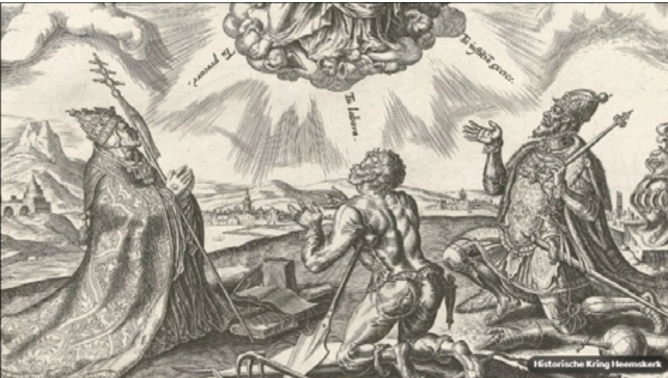
Prent van Heemskerck

In een kast bij de Historische Kring Heemskerk blijkt al jaren een prent te liggen naar ontwerp van de 16de-eeuwse schilder Maarten van Heemskerck. De gemeente kocht de prent in 1998 en schonk die later aan de geschiedenisvereniging. Daar waren twijfels over de echtheid ervan, dus het werk raakte in de vergetelheid. De conservator heeft vastgesteld dat het een gravure is van de Haarlemse Philip Galle (ook bekend als Philips). Hij maakte de prent na ontwerp van Van Heemskerck.