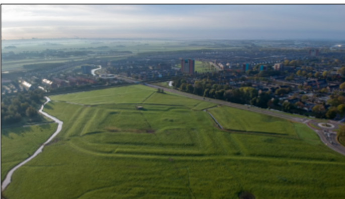
Luchtfoto van Oud Haerlem in Heemskerk

De gemeente Heemskerk gaat aanvullend onderzoek laten doen op het terrein van kasteel Oud Haerlem. Vanaf mei start het bureau Saricon met geofysisch veldonderzoek op en rondom het terrein van het kasteel. In 2020 is er al veldonderzoek gedaan. De sporen die toen zijn gevonden zijn uniek. Er ligt een groot middeleeuws kasteelterrein verborgen met een hoofdburcht van 45 bij 45 meter, een voorburcht en een voorhof. Ook is er een verdedigingsstructuur van grachten en wallen. Toch is niet het hele terrein onderzocht en in kaart gebracht. En zijn sommige delen alleen met één techniek onderzocht. Onderzoek met een andere techniek levert nieuwe informatie op. Hiermee wil de gemeente het hele rijksmonument en het terrein daaromheen in kaart brengen. Met alle informatie over het terrein gaat de gemeente in 2025 onderzoeken wat er mogelijk is om de geschiedenis van het kasteel zichtbaar en beleefbaar te maken.