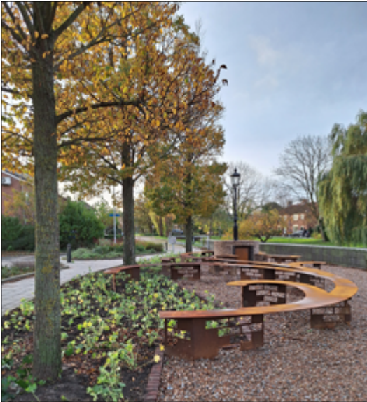
Kunstwerk Gang naar Oud Haerlem