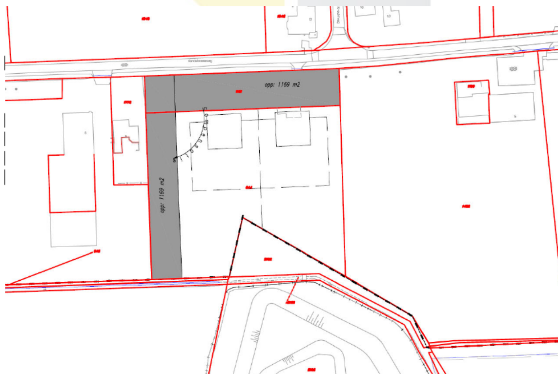
Voorstel gemeente (2 kavels met landelijke stijl huizen)