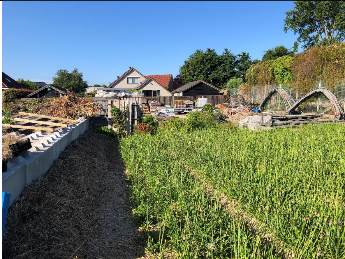
Ten westen van de schuur wordt agrarisch verbouwd.