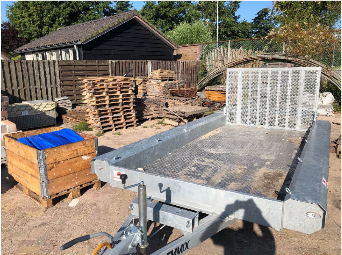
Achter de woning [REDACTED]