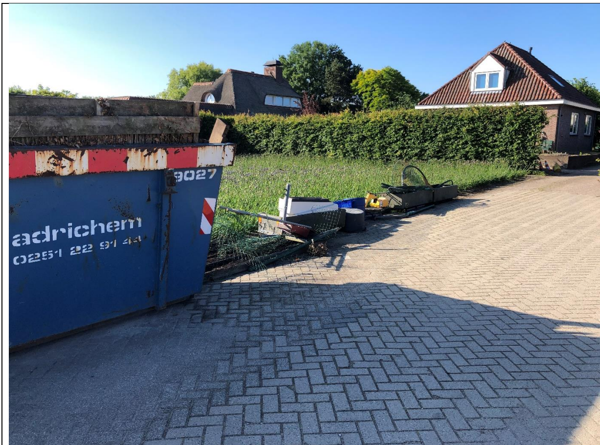
Bij de laadbak liggen nog wat losse spullen.