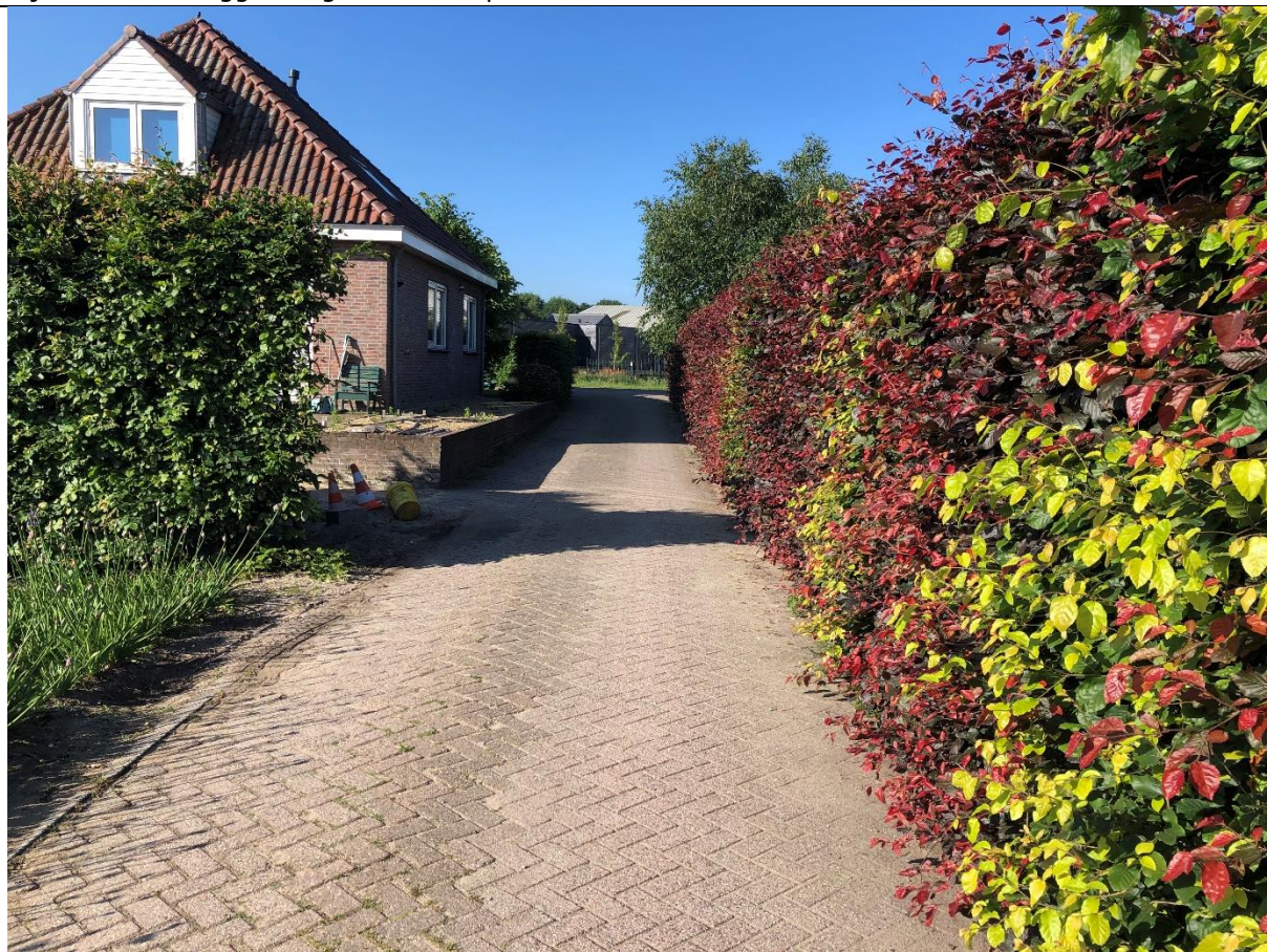
De toerit tot het achterterrein is leeg.