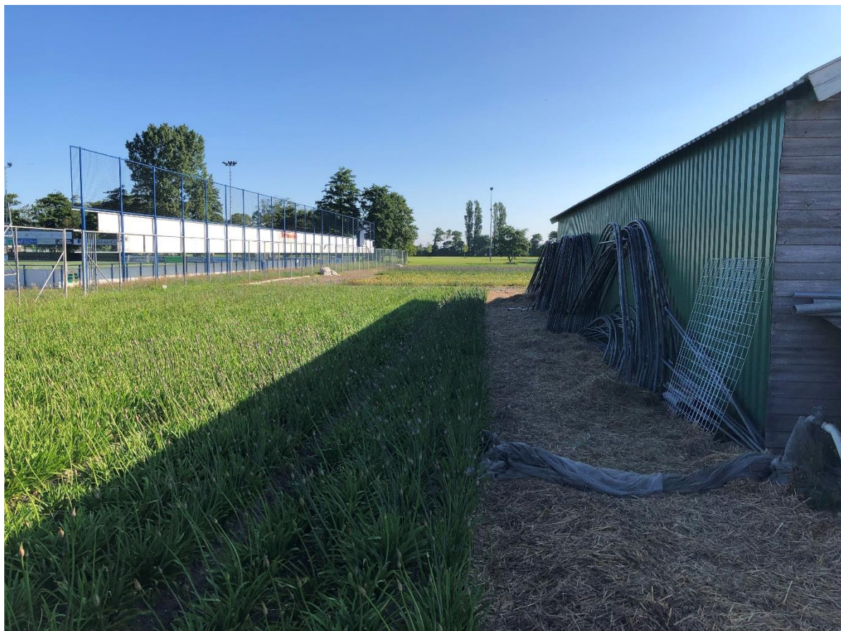
Ten westen en noorden van de schuur wordt agrarisch verbouwd.