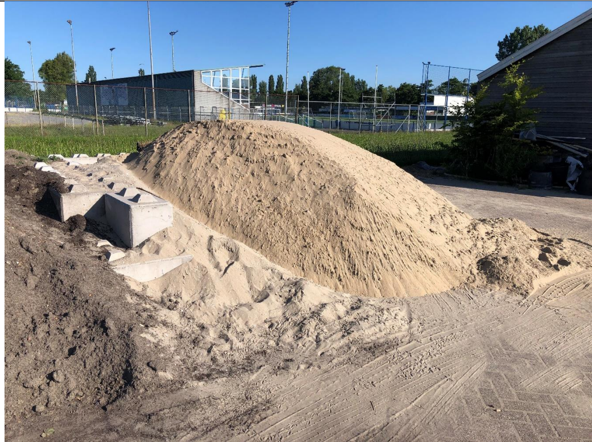
Naast het derde stuk afgezet terrein ligt een berg zand.