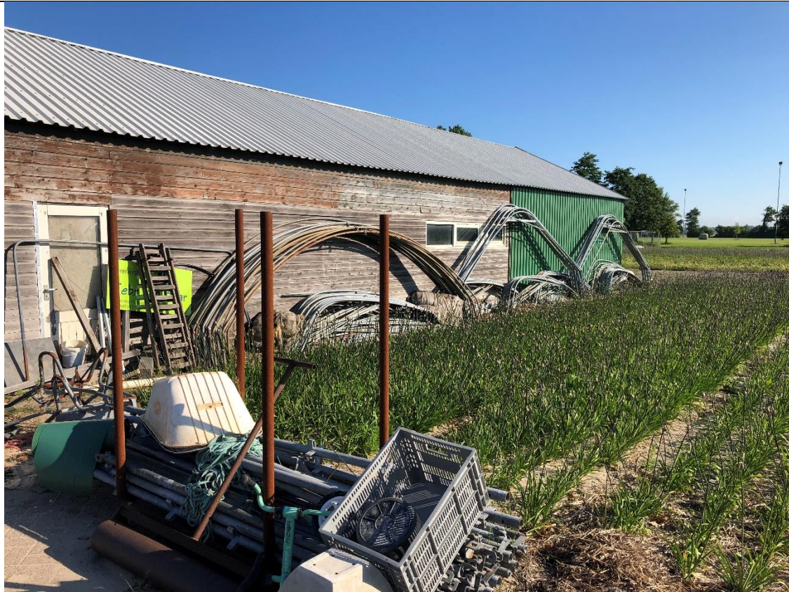
Ten oosten en noorden van de schuur wordt agrarisch verbouwd.