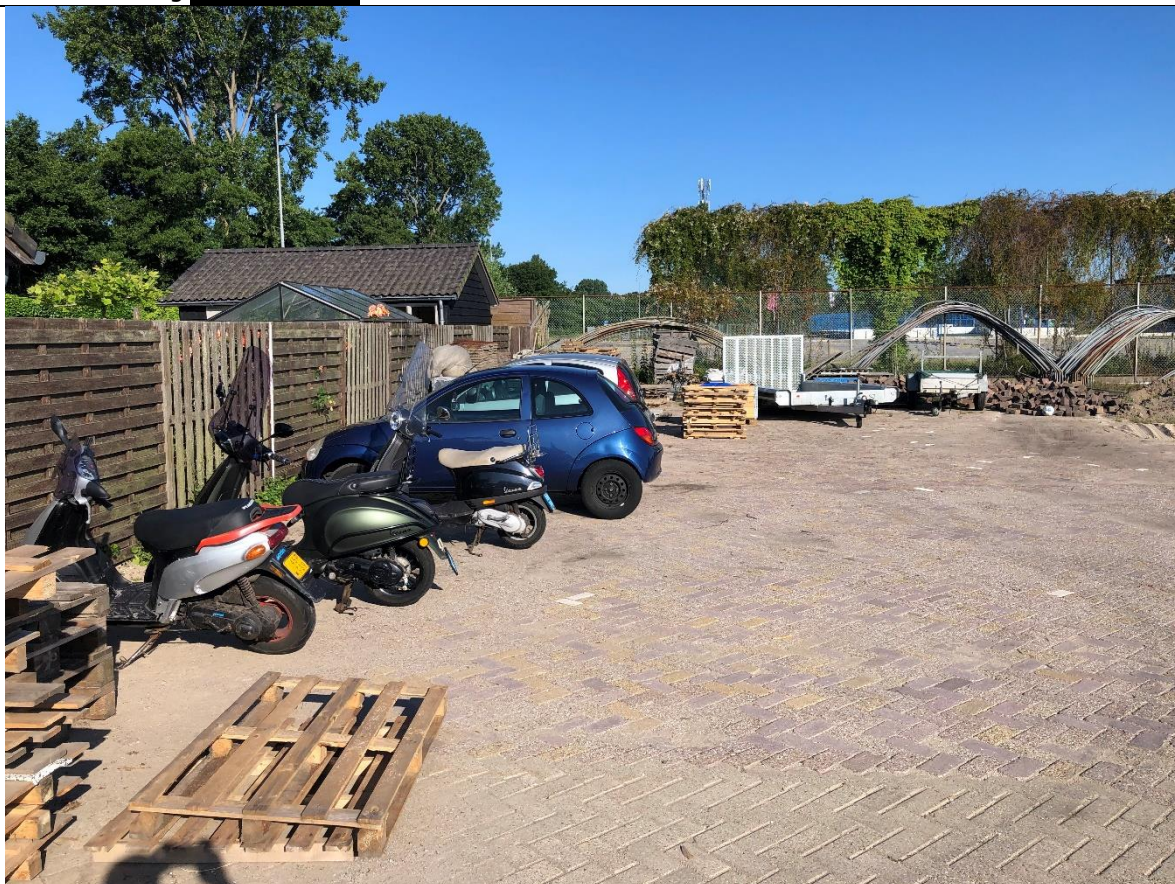
Achter de woning