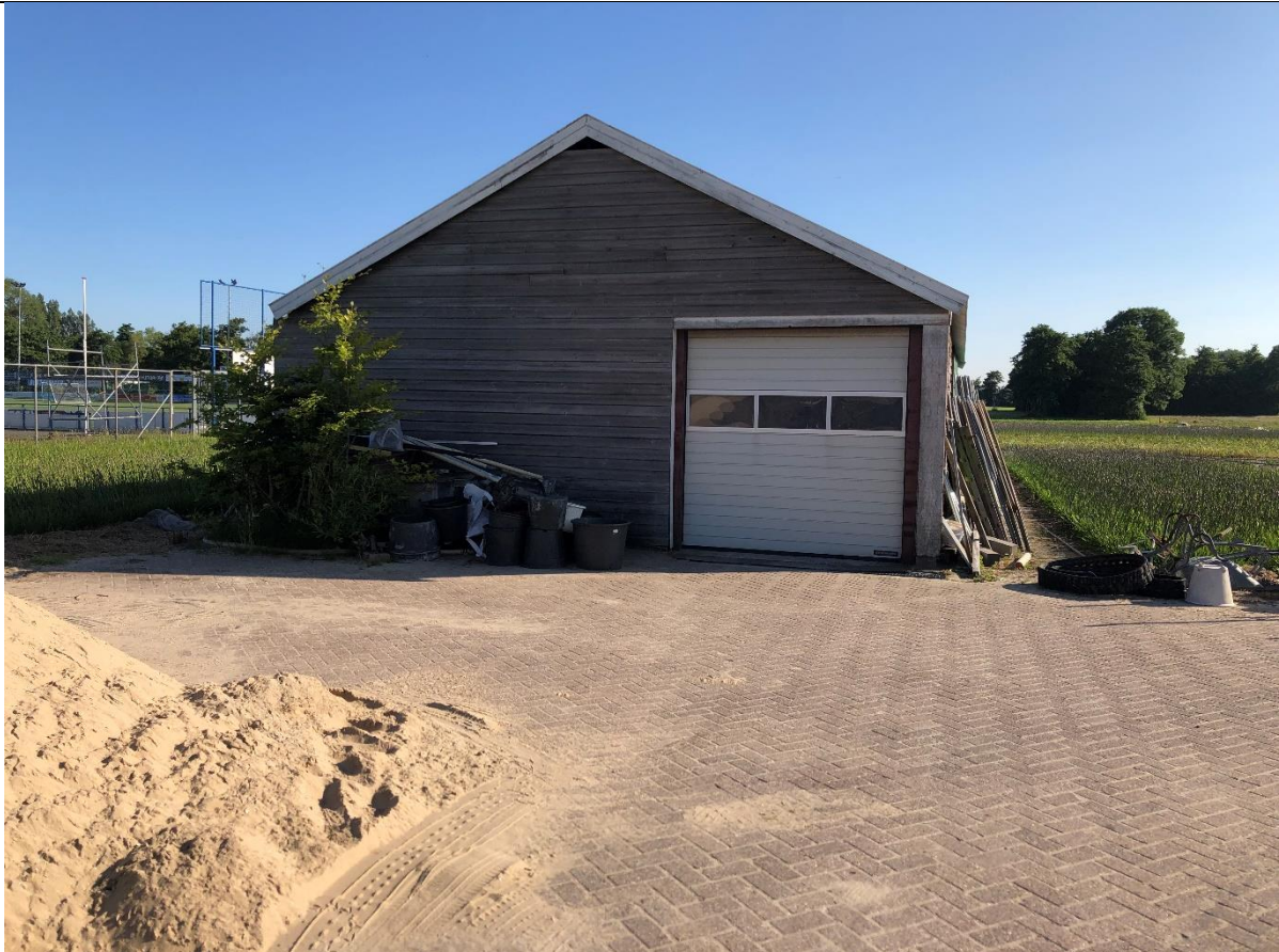
Schuur op het achterterrein.