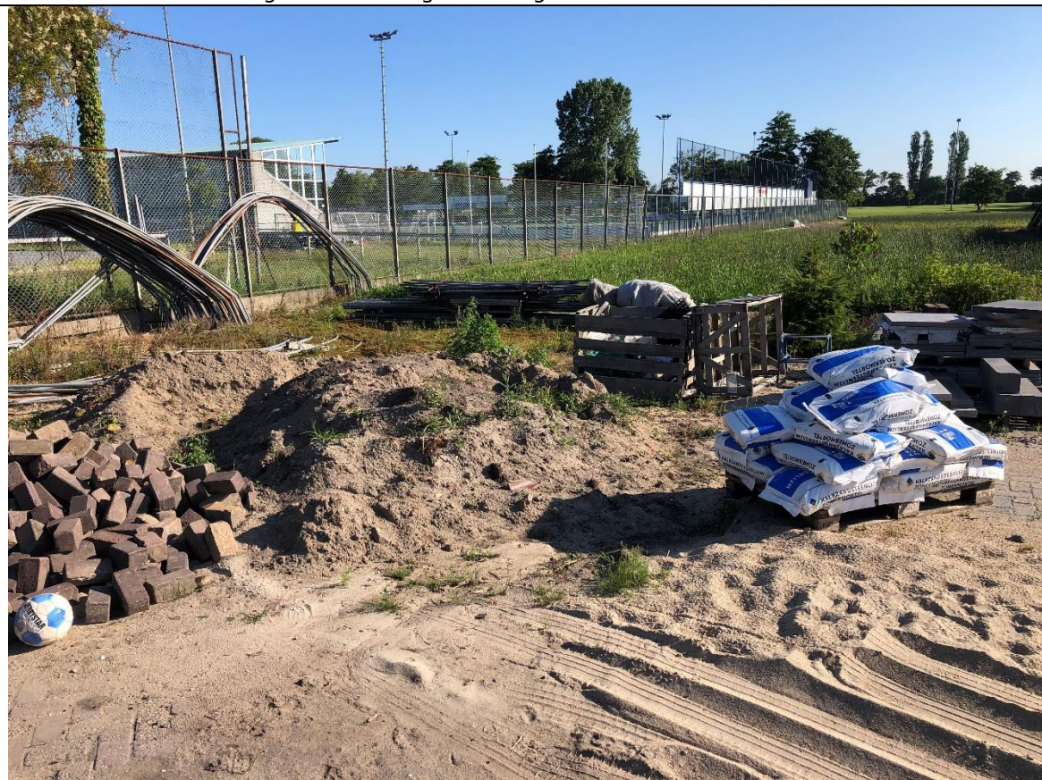
Achter de drie afgezette stukken terrein liggen stenen, een berg zand, kalkzandsteenmortel en straattegels