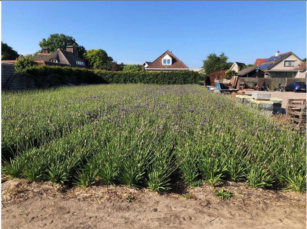
Achter de woning tot aan de schuur wordt agrarisch verbouwd.