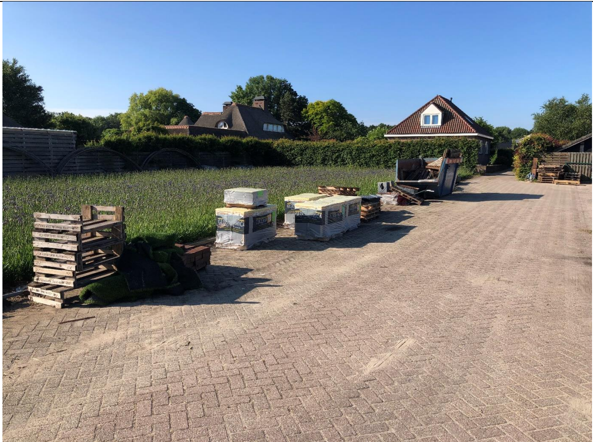
Naast het agrarische terrein staan pallets met tuintegels en een laadbak.