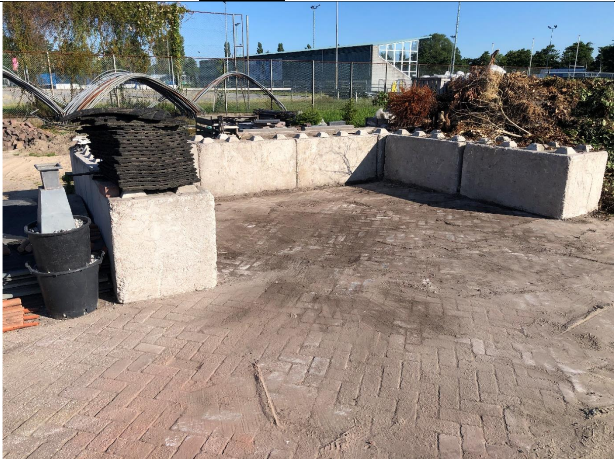
Eerste deel van drie stukken met betonnen blokken afgezet terrein.