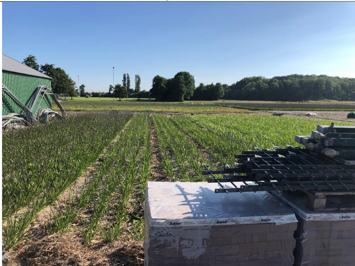
Ten oosten van de schuur wordt agrarisch verbouwd.