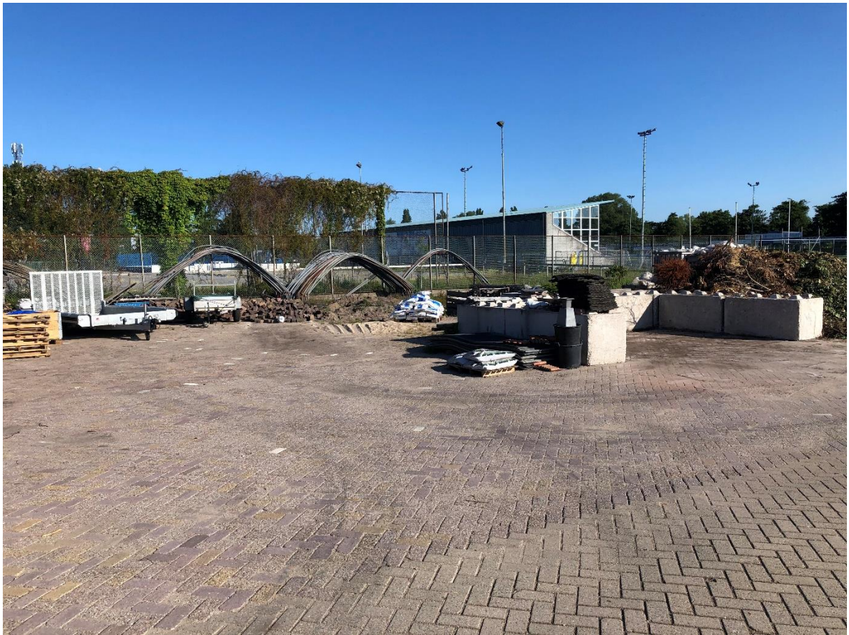
Overzicht terrein achter woning