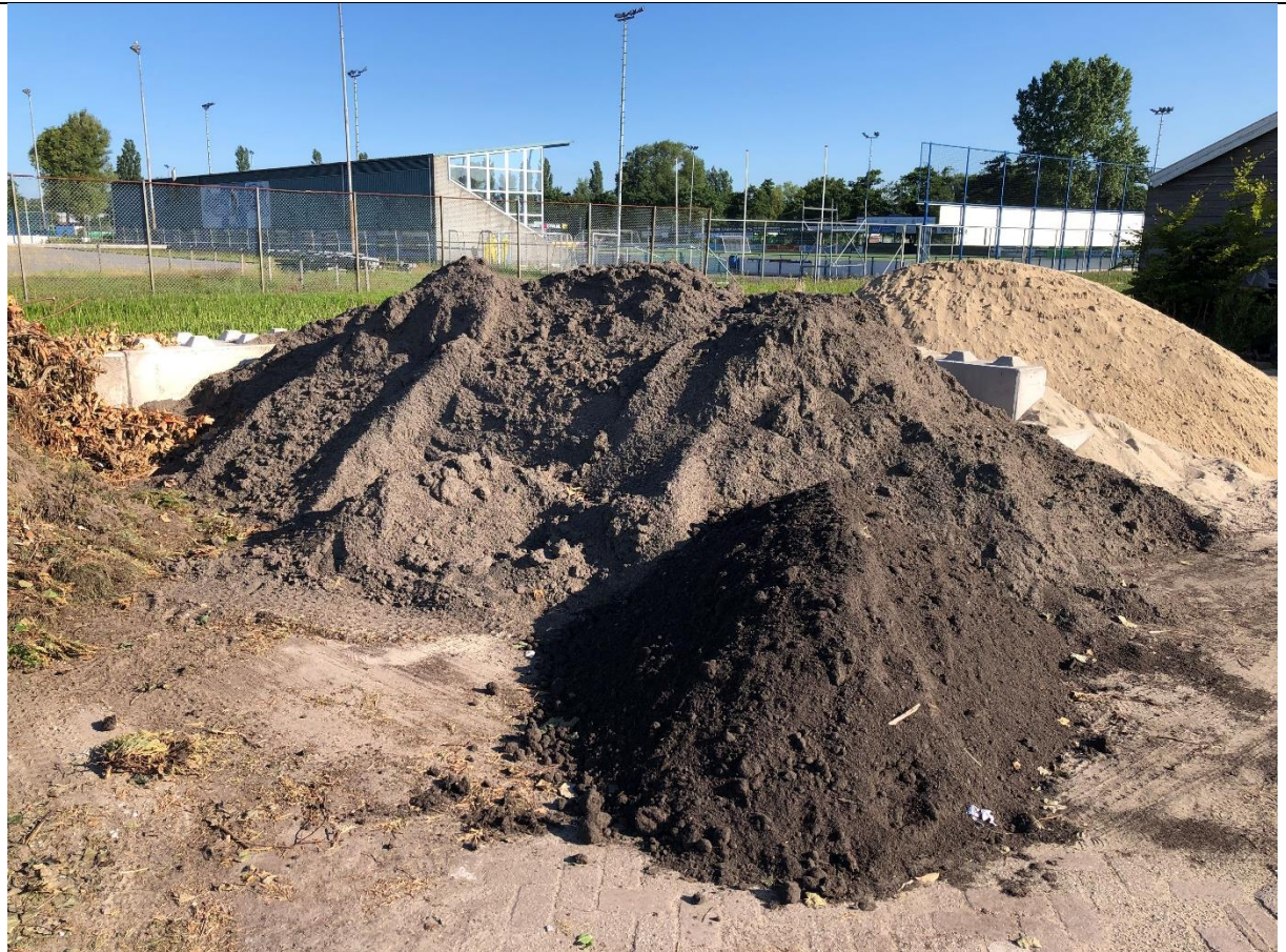
Derde stuk afgezet terrein ligt vol met grond