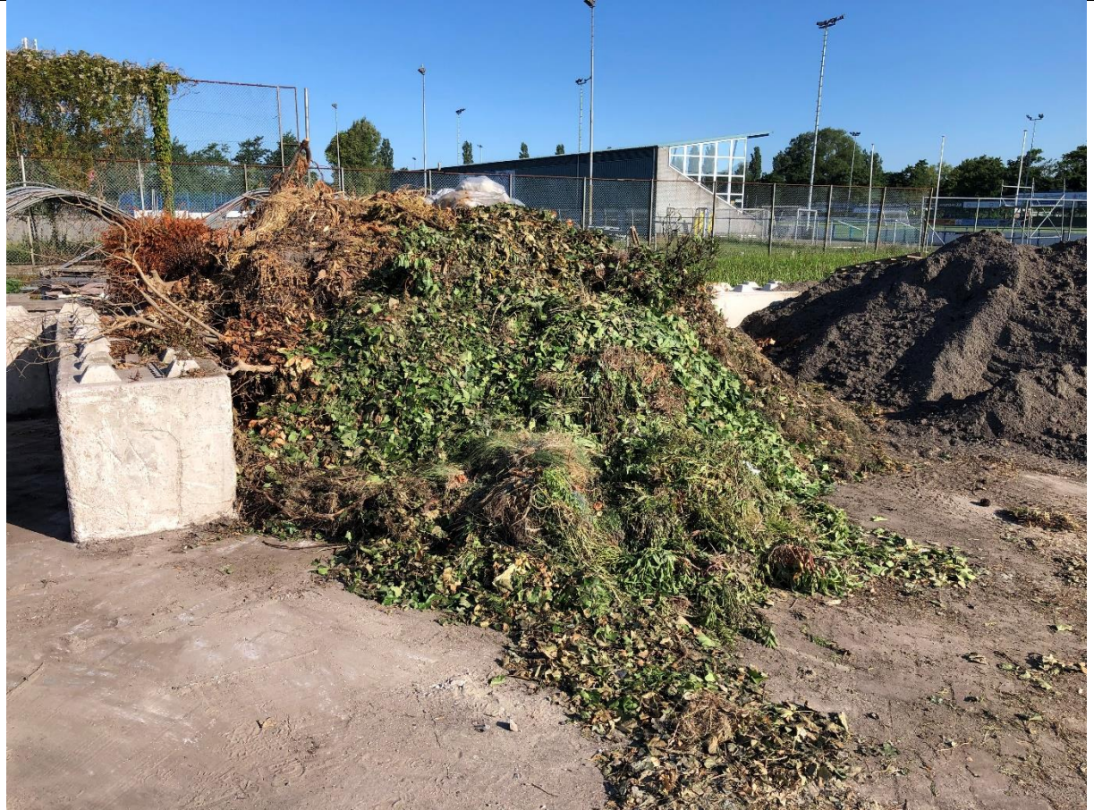
Tweede afgezet stuk terrein ligt vol met snoeiafval