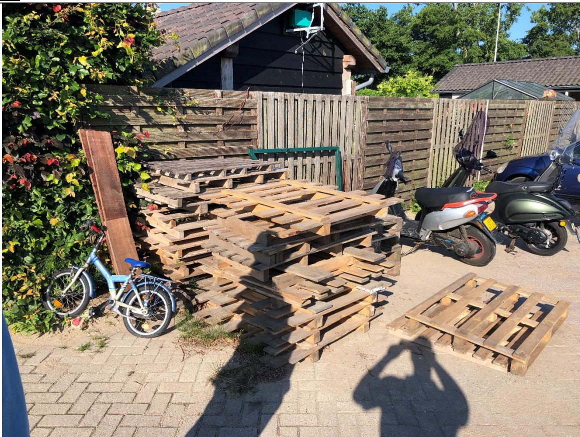
Achter de woning