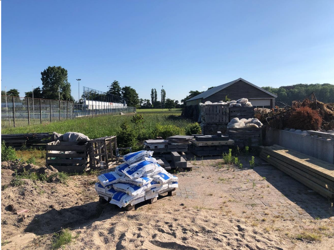
Achter de drie afgezette stukken terrein liggen stenen, een berg zand, kalkzandsteenmortel en straattegels