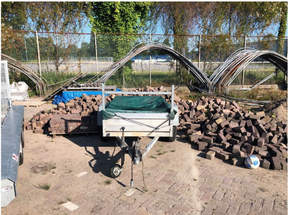
Achter de woning [REDACTED]