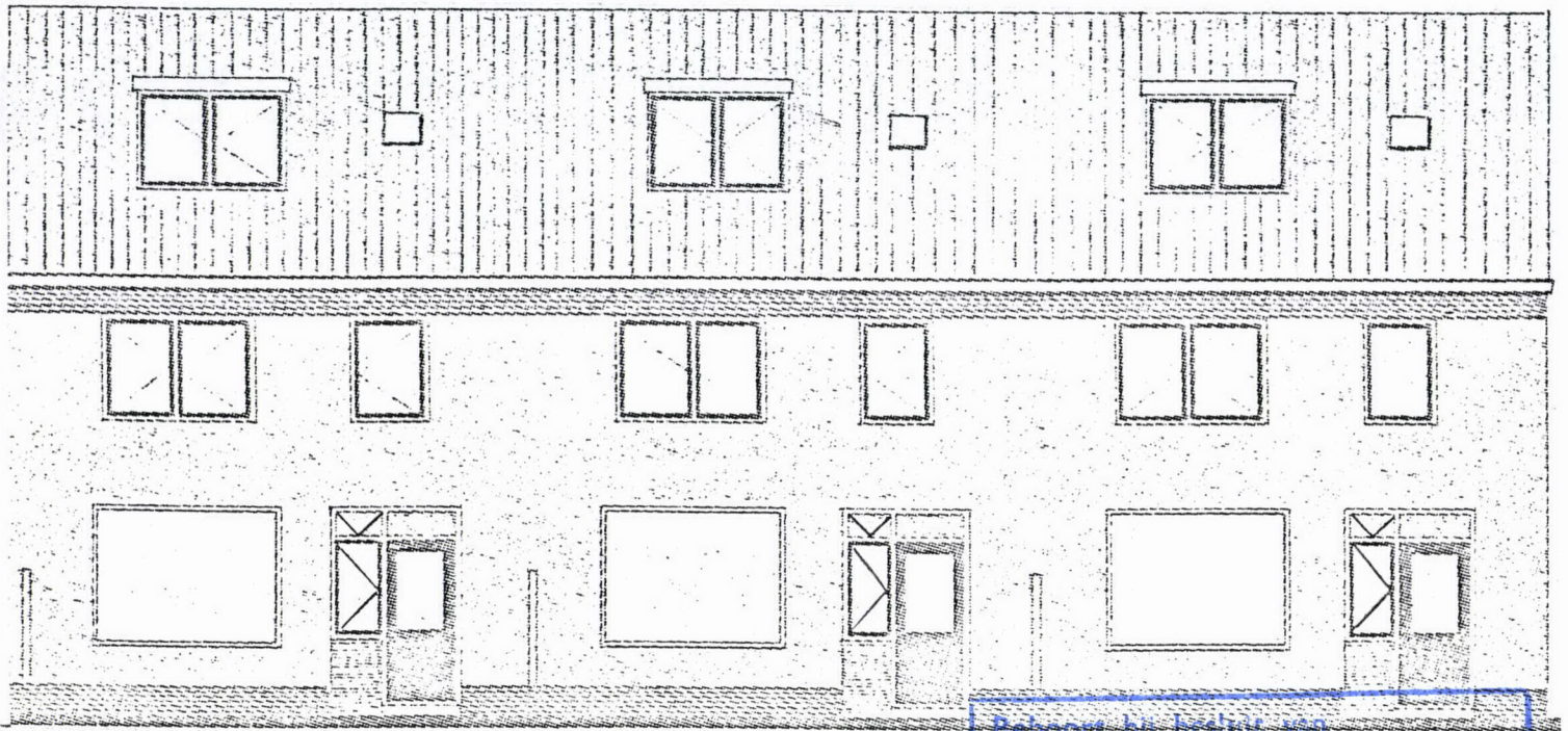
ACHTERGEVEL: bestaande situatie.

Behoort bij besluit van de Raad B. en VV. van Heemskerk dd. 5 NOV. 1985 no. 183 Mij bekend. De Secretaris van Heemskerk.