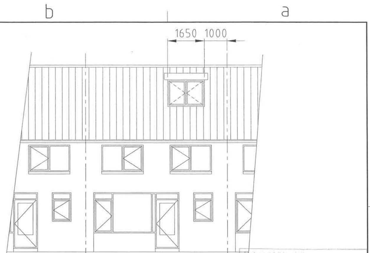
ACHTERGEVEL BESTAANDE SITUATIE

Locatie: Kadastraal bekend Gemeente: Heemskerk Sectie: B Nummer: 788 Situatie schaal 1:1000